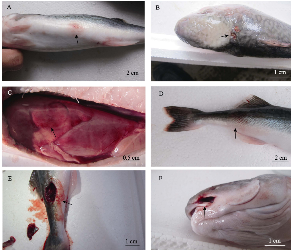
图 1 发病裸盖鱼症状