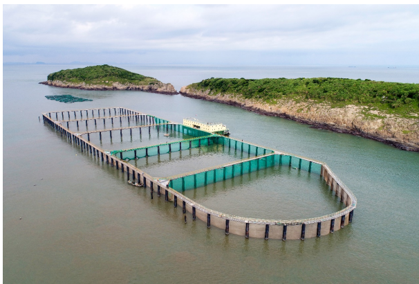
图 1 建造于半开放海域的离岸式围栏

2015 年,中国水产科学研究院东海水产研究所联合浙江温州丰和海洋开发有限公司设计研发了双周圆大跨距大型围栏设施(图 5)。该围栏外圈周长为 498 m,内圈周长为 438 m,最大养殖水体约为 30 万 m^3 ;内外圈之间的跨距高达 10 m,均有水泥管桩与