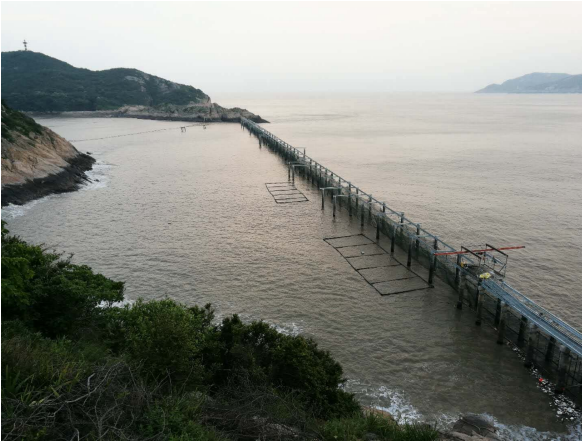
图 3 连岸式围栏 Fig.3 The shore fence