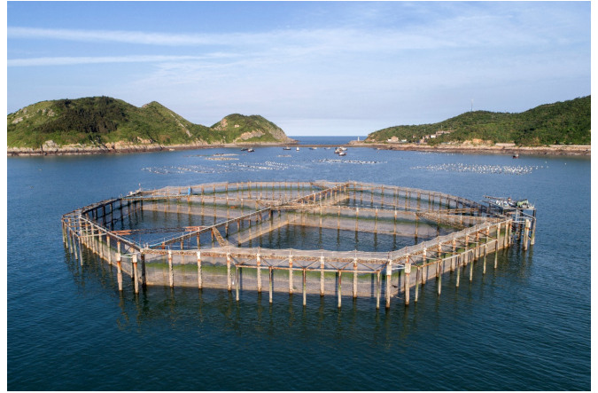
图 4 国内首个大型围栏养殖设施 Fig.4 The first large-scale fence aquaculture facility in China