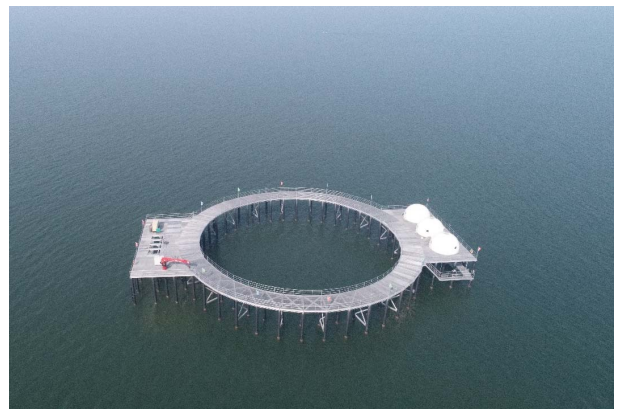
图 2 建造于开放海域的离岸式围栏